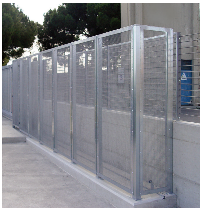
Rete a norma