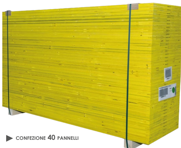
► CONFEZIONE 40 PANNELLI