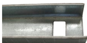
FERRI AD U ZINCATI