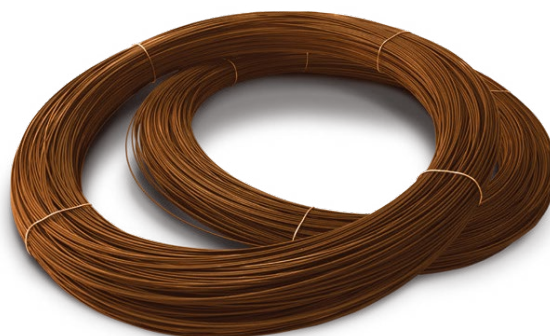
► CONFEZIONATO IN ROTOLI DA 25 Kg

In PAN si esaltano le caratteristiche tecniche tipiche dell'acciaio CORTEN, coniugando ad un aspetto interamente naturale ed ecocompatibile tutte le alte performance di resistenza e basso allungamento che lo portano a livelli superiori rispetto ai tradizionali filo zincato e filo zinco-alluminio.